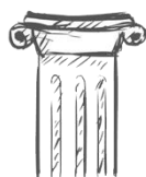
THEATER & DANS

Leer skateboarden als een pro! Skatedays heeft alle tips&tricks voor je en neemt alle benodigdheden mee. Zorg dat je dichte schoenen aanhebt en makkelijke kleding waarin je lekker kan bewegen! Bij de Jacoba.