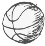
SPORT & SPEL

Schilder een hele frisse versie van jezelf. Een vraag daarbij is, wat vind jij mooie frisse kleuren: houd jij van appeltjes-groen of van knalrood en lichtblauw? Heeft een fris portret rode wangen of juist niet?